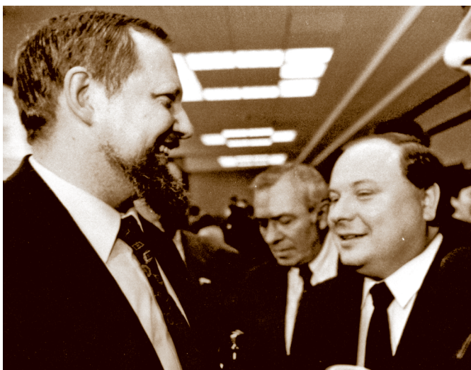
С. К. Дубинин и Е. Т. Гайдар. Государственная дума РФ. Отставка состоялась. Октябрь 1994 г.

румпированным и неэффективным. Вот где личное богатство рождалось именно по росчерку пера чиновника.