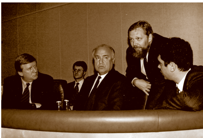
А. Б. Чубайс, В. С. Черномырдин, С. К. Дубинин и Б. Е. Немцов в ложе правительства Государственной думы. Снова нет взаимопонимания с депутатами. 1997 г.

отзывали лицензии, диктовалось объективной необходимостью. Зачастую невозможно было разыскать юридических и частных лиц — владельцев банка, конечные бенефициары не просматривались, а расчёты между сомнительными структурами проводили мелкие банки, расположенные не по указанному юридическому адресу, а неизвестно где. Сплошь и рядом случалось так, что банка нет, его лицензия давным-давно отозвана, в расчётно-кассовых центрах (РКЦ) они не значатся, в ЦБ успели забыть о его существовании, но вдруг в обороте появляются платёжки с их реквизитами, а ещё чаще их векселя.