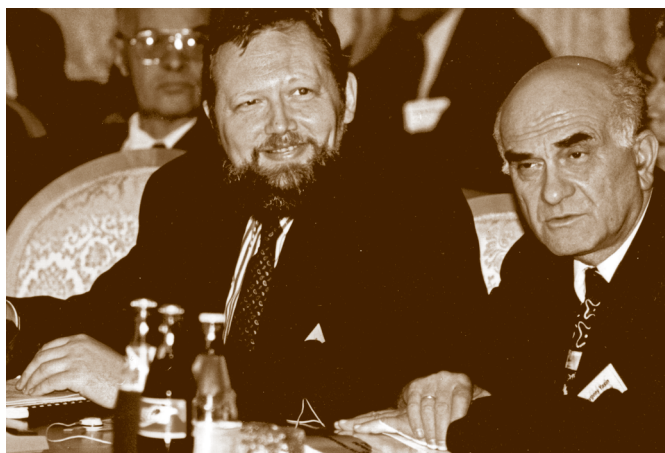
С. К. Дубинин и Е. Г. Ясин, на заседании правительства РФ. 1996 г.

лятора. При этом все заграничные банки фактически были к тому времени банкротами. В своё время они открывались, чтобы обслуживать советский плановый экспорт-импорт, поэтому Госбанк СССР поддерживал их с помощью депозитов — в частности, Моснарбанк чувствовал себя уверенно благодаря золотому депозиту Госбанка СССР. Большие кредиты заграничные банки давать не могли из-за ограниченности ресурсов, не стало централизованной внешней торговли, их капитал стал отрицательным, и существование фактически стало невозможным.