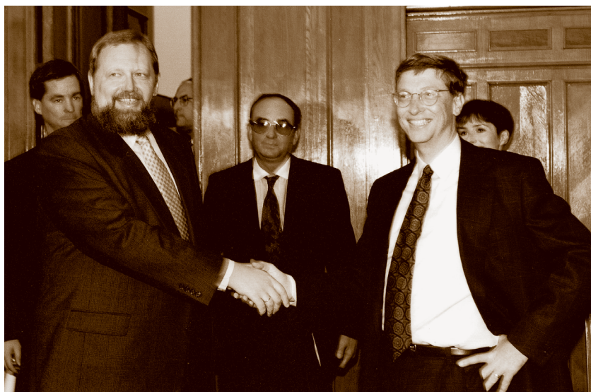
Центральный Банк РФ. С. К. Дубинин принимает Билла Гейтса. 1997 г.

пользовавшийся уважением в самых разных слоях общества, являлся наилучшим вариантом премьер-министра в условиях кризиса. Так что я честно сказал тогда Черномырдину, что ни за что не соглашусь на премьерство.