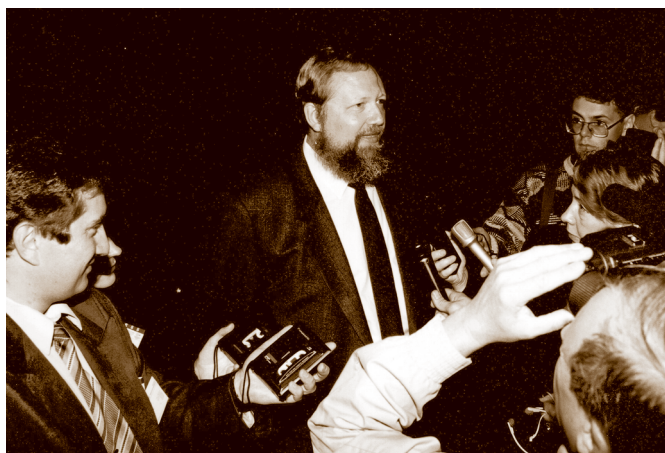
Международный банковский форум. Общение со СМИ. Последние спокойные дни перед финансовым кризисом. Москва, сентябрь 1997 г.