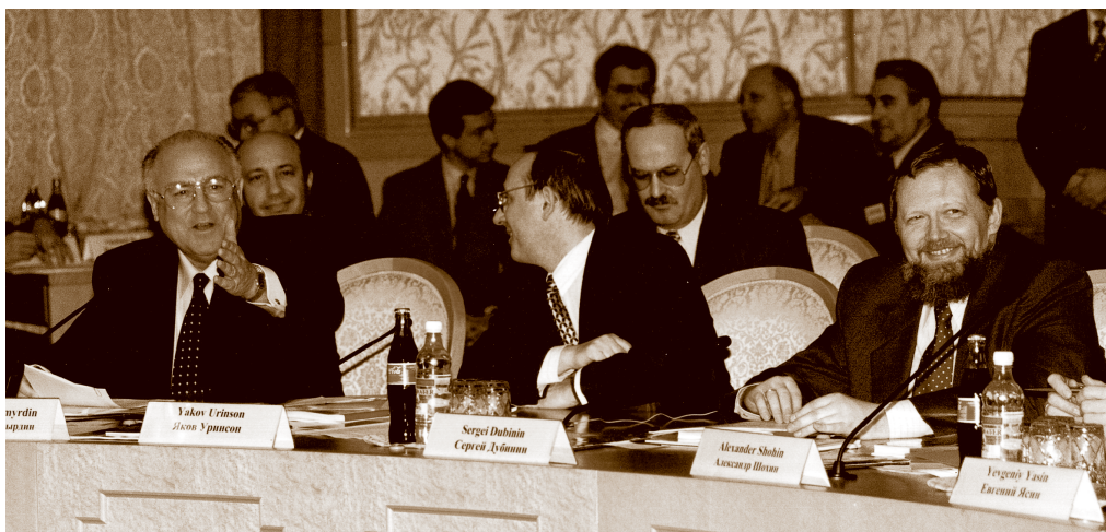
В. С. Черномырдин, Я. М. Уринсон, С. К. Дубинин и др., расширенное заседание правительства РФ. Белый дом. 1997 г.

заводился временно и тут же изымался в виде кредитов, которые никто не собирался возвращать. В отчётности обозначали фиктивный капитал банка. Не секрет, что так было в большинстве вновь созданных банков. Поэтому капиталы не стали реальным резервом банка, их собственными средствами, на которые можно было при необходимости списать убытки. Все эти недостатки банковского сектора вышли наружу в момент кризиса 1998 года.