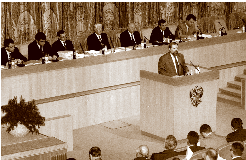
Выступление С. К. Дубинина на расширенном заседании правительства РФ. Кризис в разгаре. 1998 г.

к существенному изъятию иностранных инвестиций из России, падению цен на российские государственные бумаги, к повышенному спросу на иностранную валюту. Как результат всего этого уровень процентных ставок на финансовом рынке превышает 50% годовых.