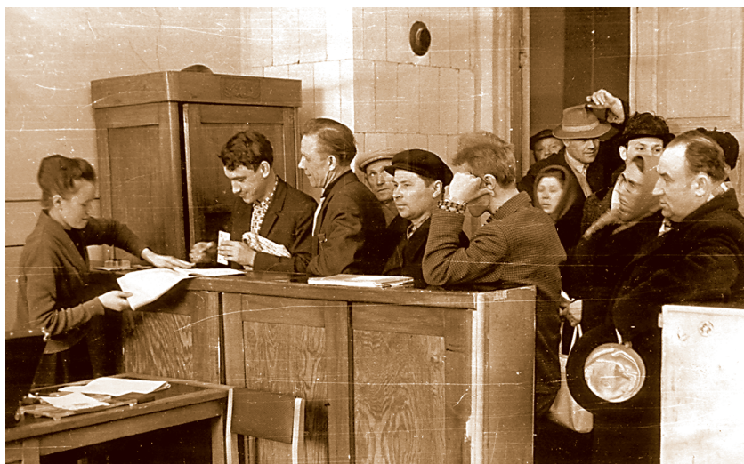
Клиенты в операционном зале районного отделения Госбанка, начало 80-х годов.

отчёт по этой позиции. При этом с нами по этому поводу никто не советовался, просто поставили перед фактом. Я ничего отправлять не стал, а когда инструктор обкома позвонил и спросил, почему мы не отчитываемся, объяснил, что таких сведений контора Госбанка не имеет, так как деньги, поступающие на расчётные счета, не обязательно перечисляются за реализованную продукцию. Они могут поступить, например, за реализацию излишков сырья, материалов, списанных материальных средств. Кроме того, бывает реализация за наличные деньги. И банк не в состоянии расшифровывать каждую операцию, тем более делать это в целом по области. В результате через два месяца обком отозвал свои указания. Так что умному начальству иногда бывает бесполезно объяснить, в чём оно неправо.