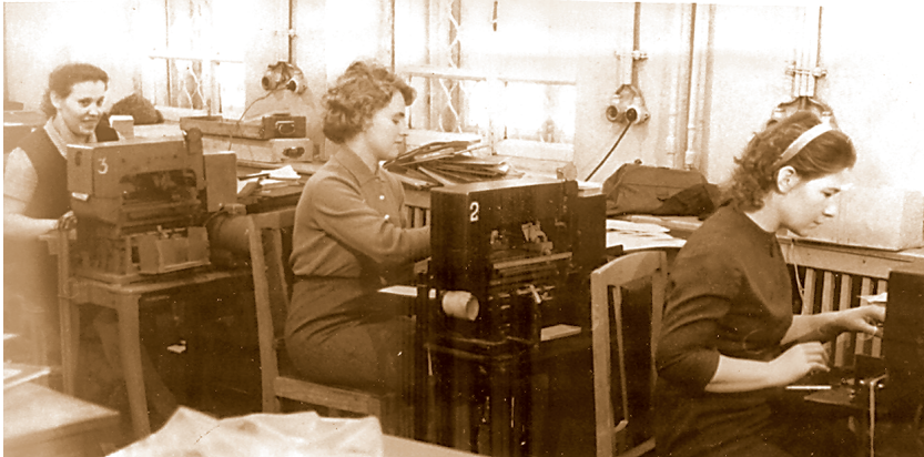
Перфорационный цех, 50–60-е годы.

Работать стало трудно, авторитет Госбанка резко упал, однако я продолжал проводить курс на сохранение в области доминирующего положения и влияния главного банка страны. За консерватизм и преданность Госбанку за мной закрепилось прозвище «пермский Геращенко».