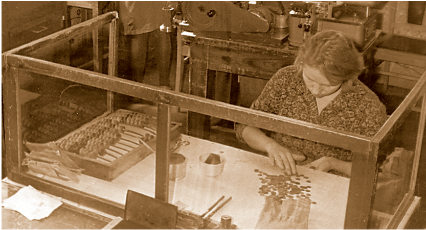
В кассе пересчёта в пермском Госуправлении Пермской областной конторы Госбанка СССР

онным технологиям. Он, кстати, стал моим преемником на посту начальника управления.