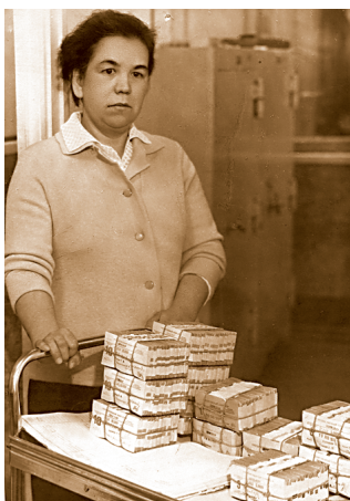
Выгрузка наличных из хранилища. Январь 1973 года.

уроки, и все последние пять лет работы в банке осваивал основные используемые программы. В результате постепенно стал понимать, какие возможности и перспективы открывает компьютеризация банковских операций.