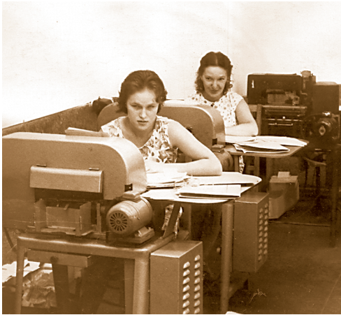
Работницы перфораторного цеха Информационно-вычислительного центра. Начало 80-х годов.