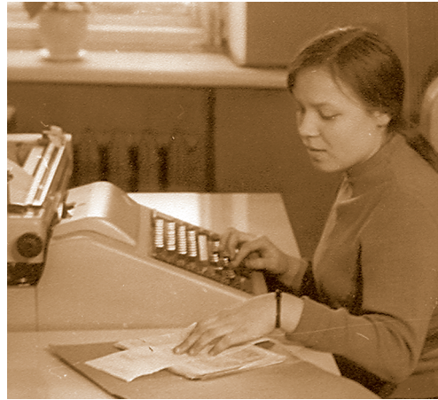
Сотрудница районного отделения Госбанка работает на бухгалтерском автомате «Аскота-170», конец 70-х годов.

Гремячинского, Губахинского и других. Руководство постоянно пыталось рассчитаться с артистами в обход инструкции, запрещавшей делать это за счёт государственных и общественных средств. Я всегда стоял на своём и ни разу не принял документы к исполнению — как бы мне ни угрожали. В ответ партийное начальство иногда срывалось, я же реагировал спокойно, зная, что прав, поэтому не обижался, а старался спокойно объяснить, почему не имею права нарушить закон. К счастью, в руководящих органах работали умные люди — объяснишь им, и они понимают. В результате меня ни разу не наказали за это. К тому же я в течение долгого времени был членом, заместителем, а потом и председателем ревизионной комиссии горкома КПСС, и начальство относилось ко мне с уважением. Недаром я одним из немногих был награжден орденом «Знак Почёта» во время работы в должности уполномоченного пункта.