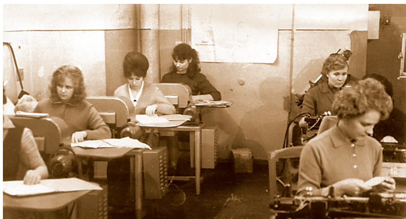
В перфорационном цехе Информационно-вычислительного центра, 70-е годы.

Главное управление в числе первых в России начало осуществлять электронные межбанковские расчёты, которые на сегодняшний день составляют почти 100 % общего объёма платежей.