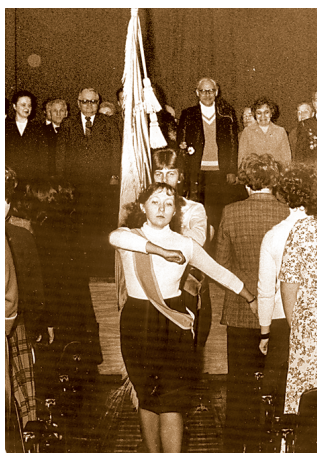
Вынос Красного знамени на торжественном собрании. Начало 80-х годов.