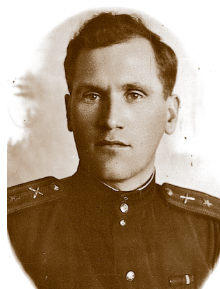
Майор. 1943 г.

и был вброшен в массовое сознание образ «угнетенной» России, лишенной права распоряжаться собственными богатствами, которой отведена роль «дойной» коровы для союзных республик. Мол, стоит выйти ей из «семьи народов», и путь к процветанию ей будет открыт. Образ этот, а вернее лозунг, рассчитанный на примитивное обывательское сознание, на полную экономическую безграмотность, сработал, привёл к власти разрушителей СССР во главе с Ельциным.