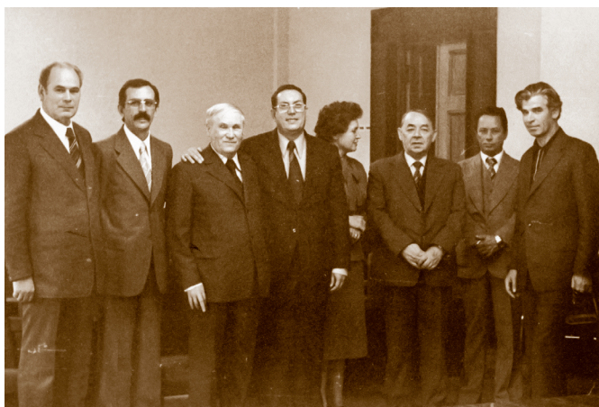
Делегация Стройбанка СССР на Кубе. 14.10.79.

целину всем миром заставил осваивать, коммунизм в кратчайшие сроки строить, кукурузу в Сибири сеять — всех его «революционных» начинаний и не перечислить. В 1964 году в высшем руководстве страны поняли, что действия Хрущёва губительны для страны, сколь бы благородными намерениями он ни руководствовался, и от власти его отстранили.