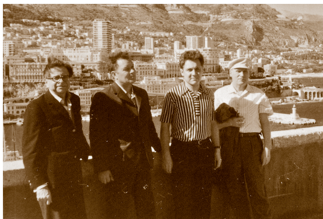
С зампредом Госбанка СССР Г. А. Трифоновым (второй справа) во Франции. 70-е гг.

замедлительно: самое малое — отстранение от должности. Но, в принципе, и партбилета могли лишить.