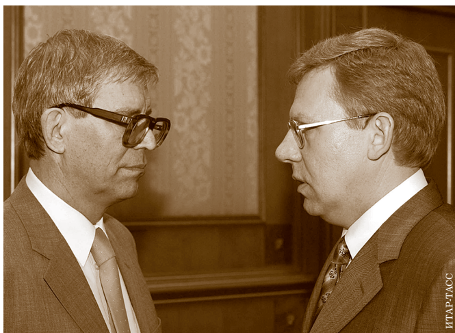
С заместителем председателя правительства А.Л. Кудриным. Заседание правительства России. 13 июня 2002 г.

стало совершенно ясно, что мы не научились прогнозировать и отслеживать состояние банков.