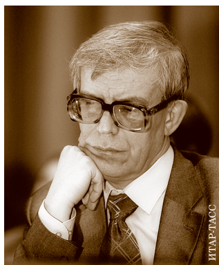
Сергей Михайлович Игнатьев