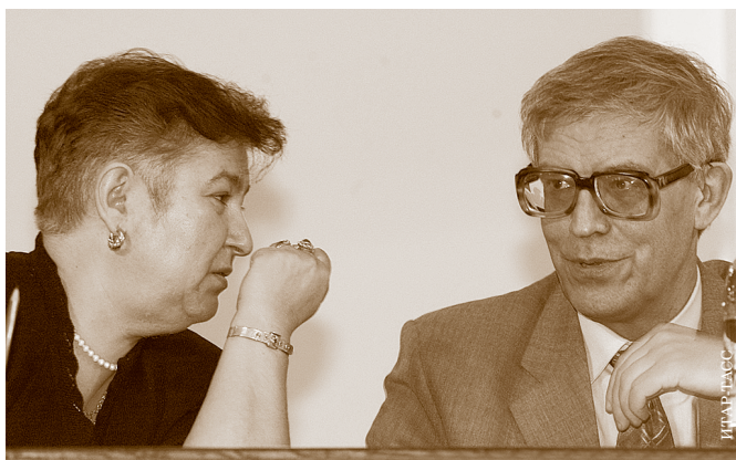
С замминистра финансов Б.И. Златкис. Юбилейная Научно-практическая конференция в Минфине РФ. 23 мая 2002 г.

нефть» и «Юкос». Многие считают, что документ был сделан по заказу. Это не так. Записка была подготовлена мною по личной инициативе.