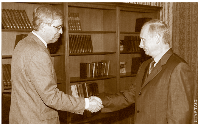
Встреча президента России с председателем Центробанка РФ. 24 июля 2002 г.

ка России. Отчёт — это всегда единый документ, а депутаты предлагали, чтобы Совет утверждал годовую финансовую отчётность. При этом отчёт о проводимой ЦБ политике должен был по-прежнему утверждать совет директоров банка. Так что же получится в том случае, если одна часть документа будет утверждена, а вторая — нет?! При этом у НБС нет своего аппарата, чтобы досконально изучить документы, как же он качественно будет работать с ними?