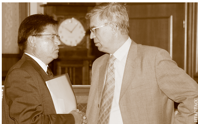
С заместителем А.В. Улюкаевым. 25 июля 2002 г.

независимость ЦБ в этот раз высказался даже руководитель бюджетного комитета Думы Александр Жуков.