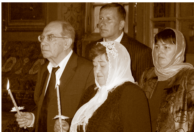
Венчание, 2006 год.

Сахалин и Владивосток (помните купюру в 1000 рублей, превратившуюся после деноминации в 1 рубль?).