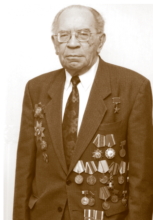
Вороново, 2008 г.

монетчики наступают нам на пятки. (Однажды на профессиональном собрании кто-то мечтательно сказал, что хорошо бы это делать ежегодно, но эту рекомендацию мои коллеги восприняли, как шутку.) Мы не дремлем, в Банке России есть отличная лаборатория, где высококласные специалисты постоянно ищут новые методы защиты денежных знаков от подделок. Поэтому всегда на всякий случай готова очередная серия денежных купюр. Причём в портфеле, как правило, несколько вариантов.