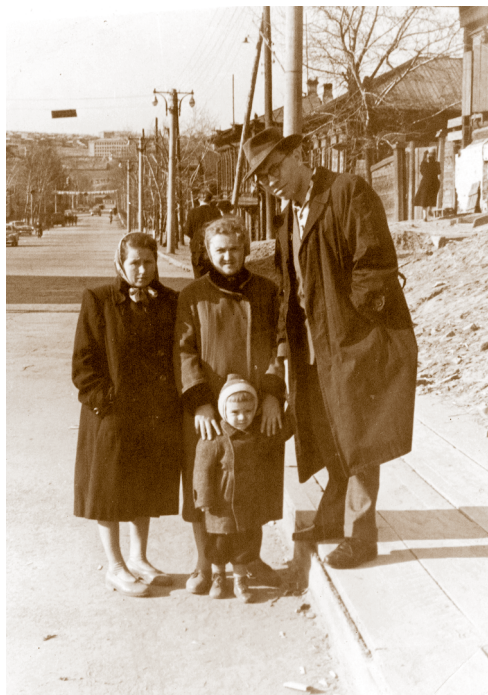
Красноярск, 1962 г.

В октябре 1975 года в Москве были организованы курсы при заочном финансовом институте для заместителей областных контор. Я сделал доклад на тему «Баланс денежных доходов и расходов и доходов населения Советского Союза» (эту тему я выбрал для диссертации, но мне её запретили писать, так как Москва не дала разрешения на использование закрытых данных). Моё выступление понравилось члену правления Госбан-