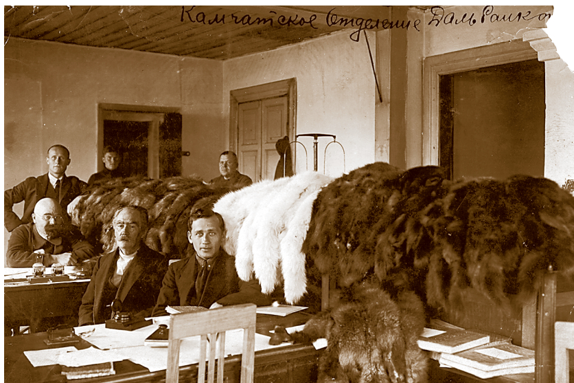
Петропавловское отделение Дальбанка (1926 год). На стойке — основная «валюта» имевшая хождение на Камчатке в те годы — мех лисы, соболя, россомахи

очень тяжёлой экономической ситуации, в которой оказалось народное хозяйство области.