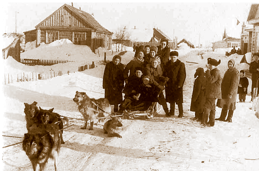
Нарта Усть-Большерецкого отделения Госбанка СССР (середина 50-х годов)