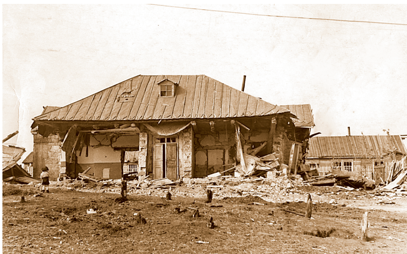
Крутогоровское отделение Госбанка СССР после землетрясения 1959 года