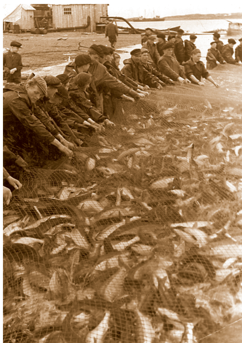
Подтягивание невода в Усть-Камчатском районе (конец 50-х годов);

именно в такие периоды значительно росли показатели сверхплановой эмиссии. К примеру, в 1977 году рыбодобывающие и рыбообрабатывающие предприятия Камчатки в несколько раз (в 4–5 раз!) перевыполнили установленные планы добычи лососёвых пород по прибрежному лову. Для переработки выловленной рыбы на Камчатку с материка были завезены сезонные рабочие. Кроме того, для выгрузки тары и соли, которые потребовались рыбозаводам в больших количествах, привлекались рабочие с добывающих судов. В тот год работники рыбной отрасли получили большие доходы. И возникли серьёзные трудности с вовлечением их в торговый оборот (не хватало товаров), во вклады или на аккредитивы в сберкассы. Преимущественно деньги, полученные сезонными рабочими и экипажами судов, вывозились за пределы области. В результате в 1977 году плановый показатель эмиссии был превышен в 3 раза.