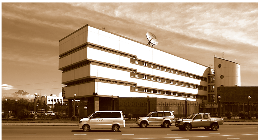
Здание Главного управления в г.Петропавловске-Камчатском (современный вид)

него были небольшие, поэтому мы не казались интересными заказчиком, и подрядные организации занимались строительством нашего здания по остаточному принципу. Правда, административное здание всё-таки было возведено относительно быстро, поскольку оно строилось из типовых конструкций прямоугольной формы, по типовому проекту, а вот помещения ГРКЦ и кладовой должны были располагаться в круглом здании, перекрытия которого были трапециевидными. Каждое перекрытие для них следовало изготавливать индивидуально, с применением специальных форм, заливок, просушек и т. д. Естественно, подрядные организации относились к нашему объекту очень настороженно, и его строительство шло медленно, партнёры осваивали всего по 100–150 тысяч рублей в год.