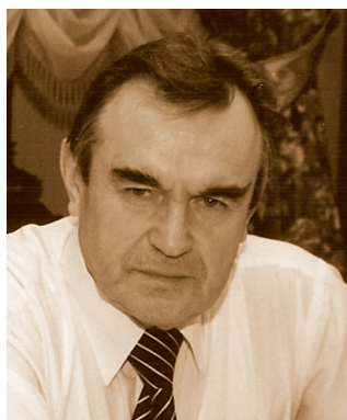
Станислав Фёдорович Спицын