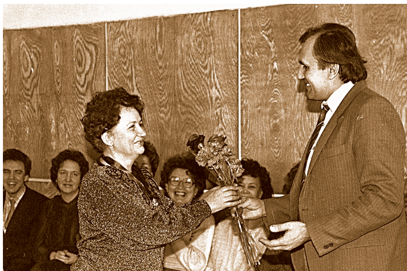
Чествование юбиляров краевой конторы. 1990 г.