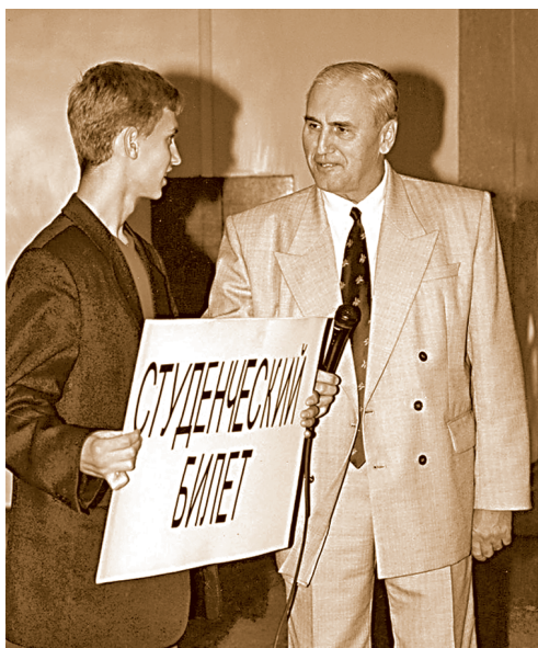
Посвящение в студенты Международного института финансов, кредита и банковского дела Тихоокеанского государственного экономического университета.