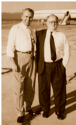
С председателем Банка России В. В. Геращенко. Владивосток, 1994 г.

процессом, если хотите, чтобы ваши указания выполнялись, то закон должен быть принят!» — предъявил я последний аргумент. Накануне уже акционировался Жилсоцбанк СССР, готовились к акционированию Промстройбанк СССР и Агропромбанк СССР. После этого обращать внимания на республики никто не будет! «Что вас смущает, Руслан Имранович?» — спрашиваем. «Юридическая чистота документа!» — ответил Хасбулатов. У нас она сомнений не вызывала, поэтому мы начали убеждать его не сомневаться в правильности принятых решений. В результате приняли компромиссное решение — переделать документ из проекта закона в проект постановления. После этого мы все побежали оперативно его дорабатывать.